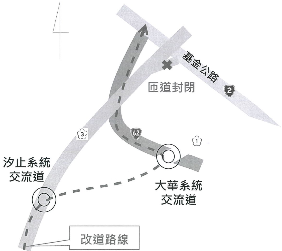
圖3北出基金交流道封閉，改道示意圖