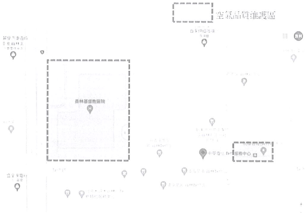
員林基督教醫院空氣品質維護區管制(紅色)範圍