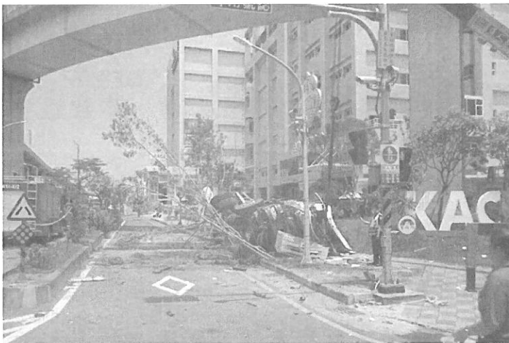
圖 1 109 年 8 月 16 日國 1 南向高雄端水泥預拌車翻覆事故，造成 1 人死亡。