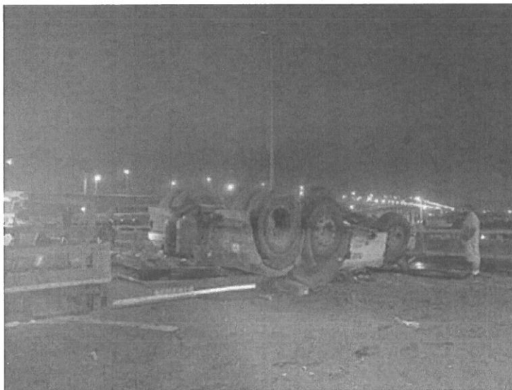
圖 2 109 年 9 月 30 日國道 3 號彰化系統交流道氫氣槽車翻覆事故，造成 1 人死亡。